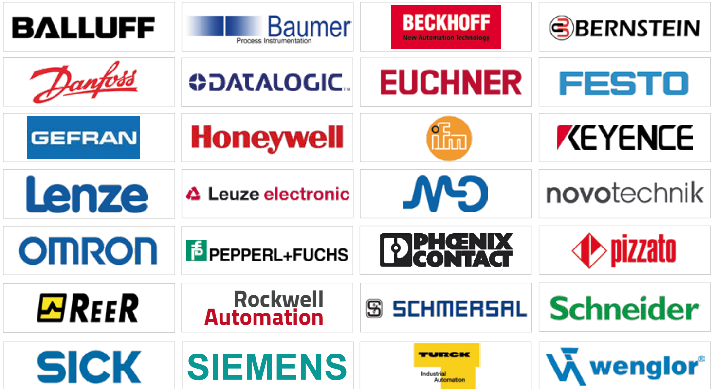
ABB AECO AEG ALEPH AMRA ASCON ATECO AUDOLI B&B B&R BDC BALLUFF BANNER BARTEC BAUMER BECKHOFF BERNSTEIN BINDICATOR BIRCHER BOSCH-REXROTH BREMAS-ERSCE BURGESS BURKERT BUSSMANN CAMLOGIC CAMOZZI CAREL CDC CET COELBO CONTELEC CONTRINEX CONTROL TECHNIQUES CROUZET CRYDOM CUTLER-HAMMER DANFOSS DATALOGIC

DELTA DIELL DI SORIC DKC DOLD DROPSA DUNGS EATON MOELLER ELCO ELCONTROL ELECTRICA-AMF ELESTA ELIWELL ELTRA ENDRESS HAUSER ENTRELEC ERO ELECTRONIC ERSCE EUCHNER EUROTEK EXOM FANTINI & COSMI FERRAZ SHAWMUT FESTO FIBER FIESLER FINDER FUJI FUJITSU G.E. POWER CONTROL GAVAZZI GEFRAN GHISALBA GIOVENZANA GO-SWITCH GRASSLIN HARTMANN HEIDENHAIN